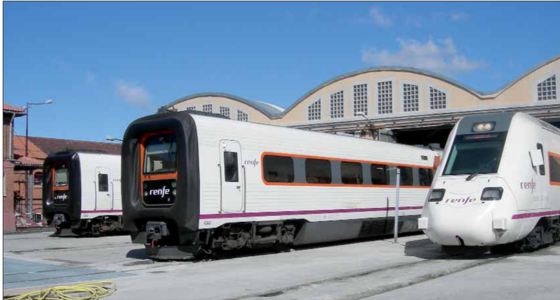
La idea que persigue la Dirección de Trenes con los trenes 594 es equiparlos en los ámbitos posibles a los R-598.

un tren 594 ó de un R-598. Para romper con la idea que los pasajeros tienen formada del interior de los TRD se introducirán en las salas, aprovechando esta actualización, un repintado de los paneles, nuevos suelos, recubrimientos superiores y tapizados, y también una máquina de venta de bebidas y aperitivos, abriendo por lo tanto una zona vending similar a la de las composiciones R-598, lo que restará cuatro plazas a la capacidad de los TRD 594.