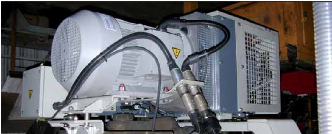
Este es el nuevo modelo de compresor con el que se pretende mejorar la producción de aire.

los nuevos compresores, los cuales tienen un 30 por ciento más de capacidad de generación de aire, además de que su ubicación en el bastidor ha variado y ahora se puede considerar que térmicamente es más desahogada.