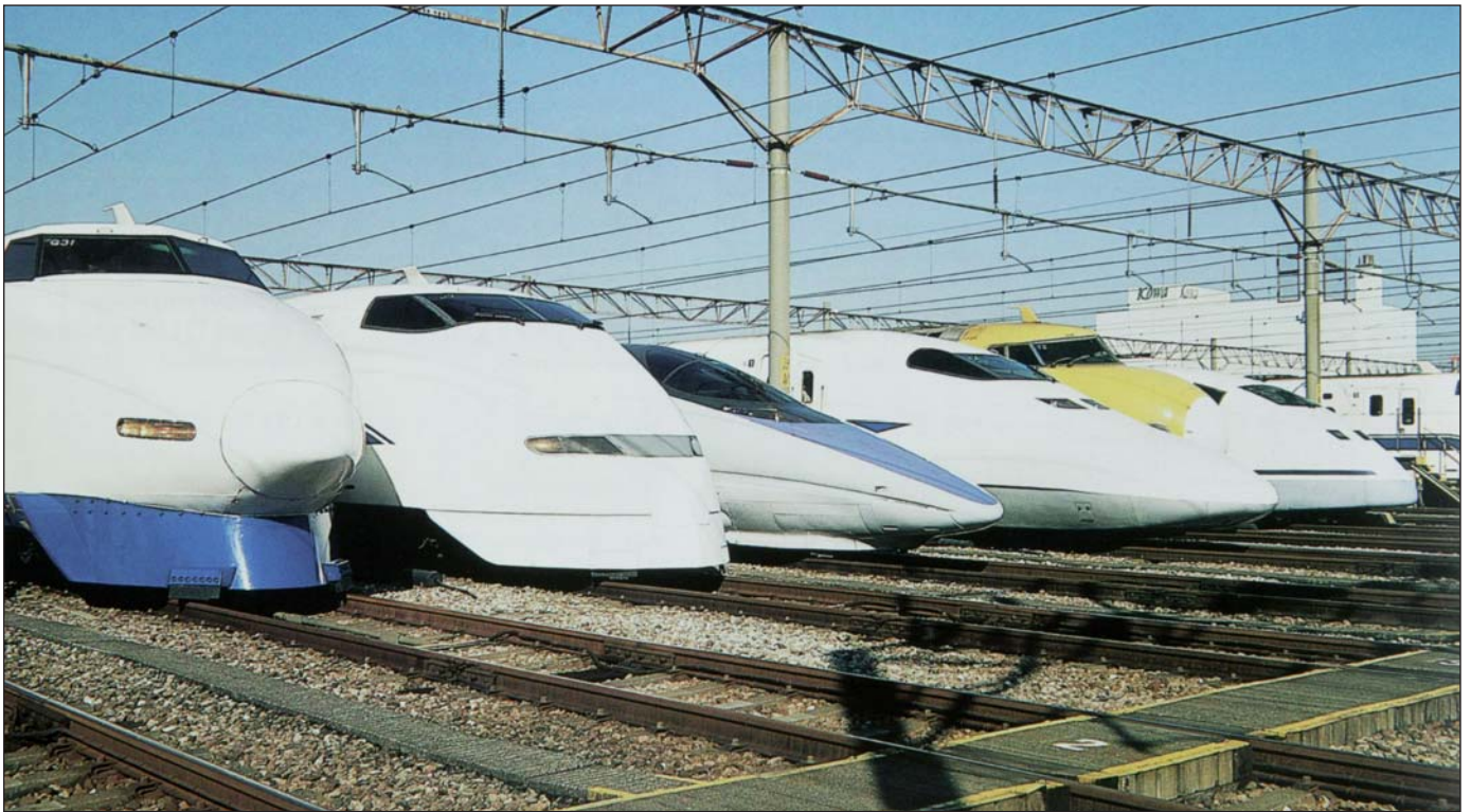
De izquierda a derecha Series 100, 300, 500, 700, "Doctor Yellow" T2 y 300X.