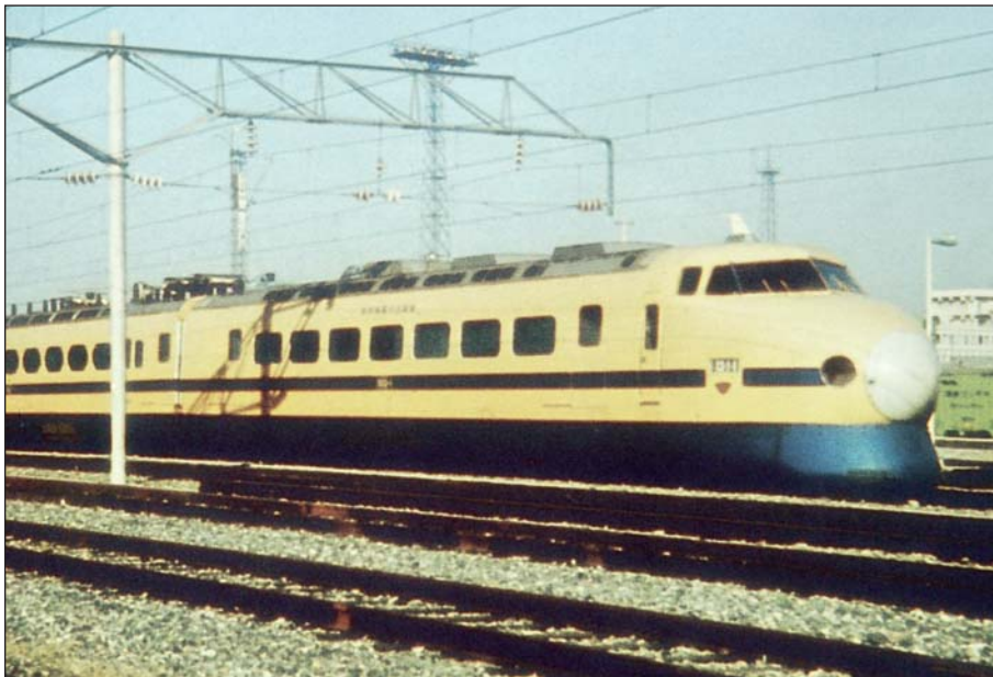
Doctor Yellow, tren de inspección.

En marzo de 2002, comenzaron las investigaciones para desarrollar un nuevo