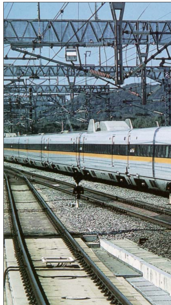
Serie 700, cruzando con un tren serie 0.

Son las primeras en equipar un sistema de pendulación y airbags en la suspensión