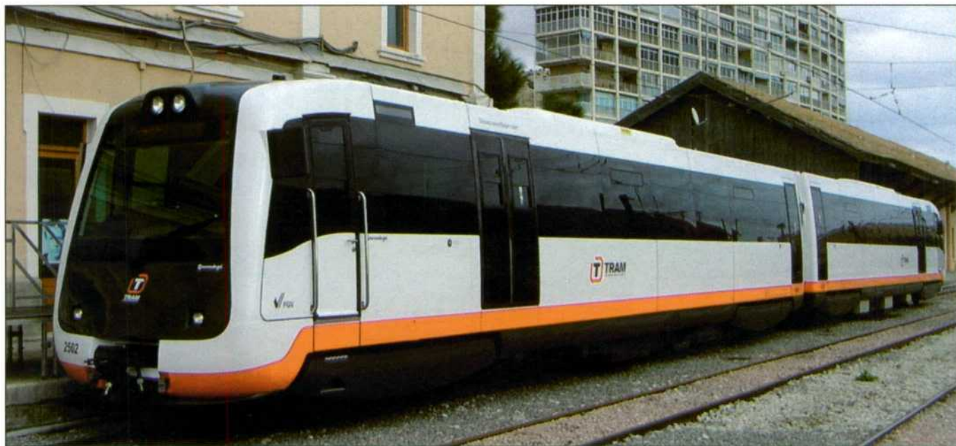
Automotor "man" reformado.

gie y actuación sobre las llantas por zapatas. La suspensión primaria es por doble muelle helicoidal y la secundaria de muelle helicoidal y caucho.