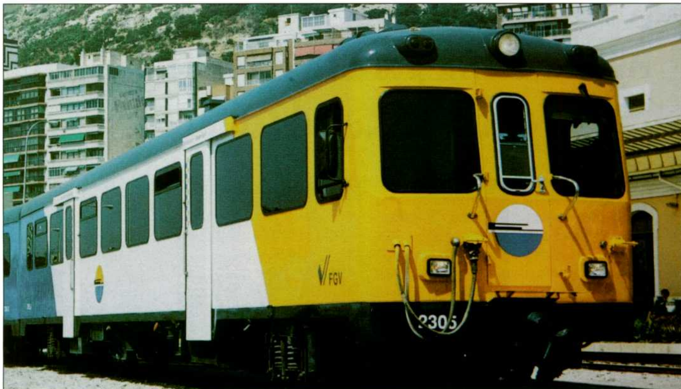
Automotor "man" de FGV en el que se basa la nueva serie 2500.

FGV HA INVERTIDO 7,21 MILLONES DE EUROS EN LA MODERNIZACIÓN DE SEIS UNIDADES