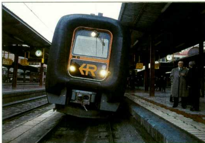
TRD con el sistema de basculación SIBI, desarrollado por CAF.

Casi un año después de que circulara por primera vez una unidad de regionales de la serie TRD con el sistema de basculación SIBI (Sistema Inteligente de Basculación Integral) se ha presentado el primer tren basculante de fabricación nacional, desarrollado por CAF. Este sistema se incorporará a los siete próximos trenes TRD que Renfe tiene previsto comprar. El sistema de basculación permite incrementar la velocidad en las curvas, sin que se resienta el confort del viajero.