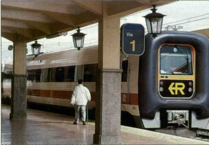
El sistema mantiene el confort del viajero.

modidad e incrementos de velocidad limitados- se deben al retraso que se produce en la detección de la curva, que fuerzan a una actuación rápida que resulta molesta para el viajero e impide un incremento de velocidad sustancial. Ilustra bien esta afirmación un estudio reciente de la SNCF en el que se observa que para una aceleración no compensada de 2 m/s 2 , los porcentajes aproximados de viajeros con vómitos y ligeras náuseas son respectivamente del 11 y 58 por ciento.