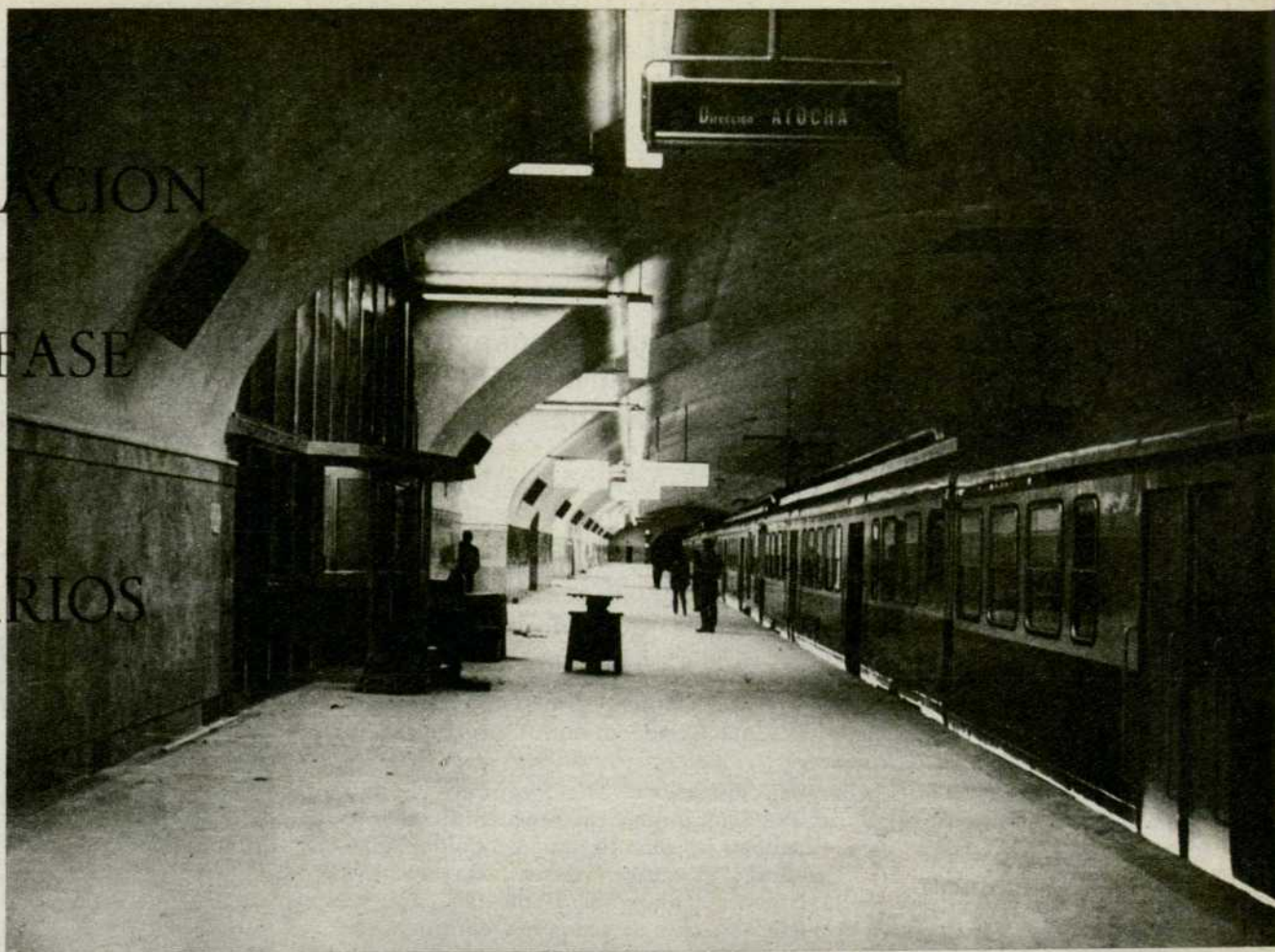
Estación de los Nuevos Ministerios.