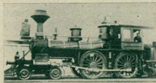
Locomotora serie 33-38