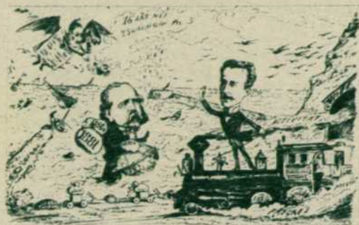
Caricatura de 1881 referente al ferrocarril de Barcelona a Villanueva

Para todos nuestros lectores resultan familiares las pintorescas locomotoras que aparecen en las películas «del Oeste». Lo que seguramente muy pocos saben es que en España hubo locomotoras y trenes de estas características.