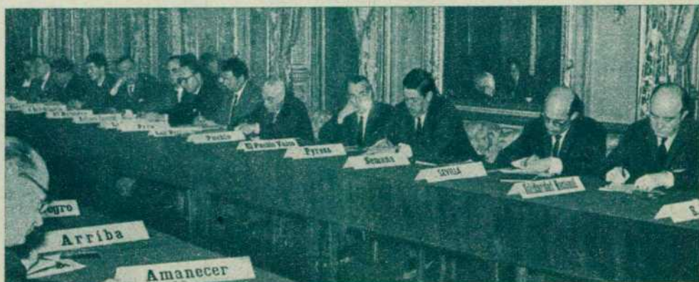
Periodistas de diarios y agencias reciben amplia información en la rueda de prensa