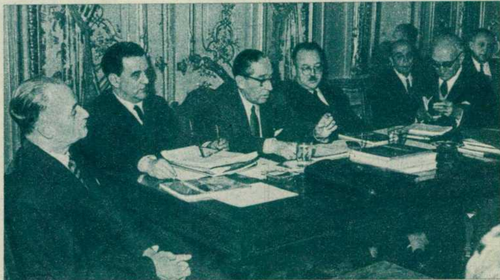
La presidencia en la rueda de prensa celebrada en el palacio del Consejo de RENFE

De este modo el país ha podido recibir una información fidedigna y amplia de un Plan que a todos afecta y a todos beneficia.