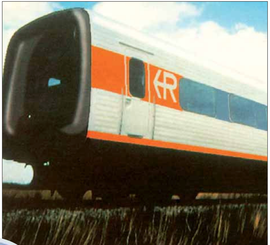
Renfe adjudicó los nuevos trenes regionales, nacían los TRD.