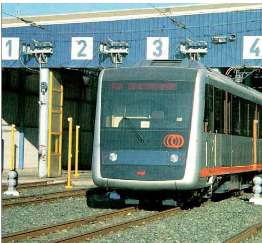
En noviembre se inauguraba la primera línea del Metro de Bilbao.