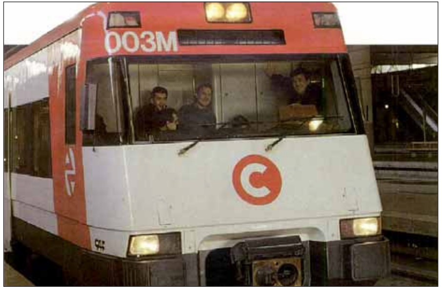
El año del Plan de Transportes de Cercanías

presidente del Gobierno, y que se diseñó para solucionar los problemas de tráfico en las grandes concentraciones urbanas.