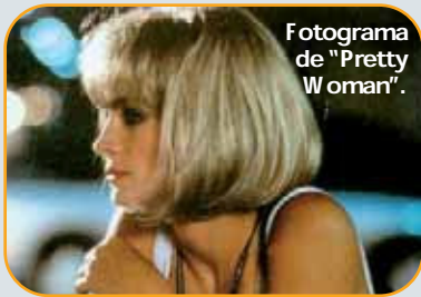
Fotograma de "Pretty Woman".