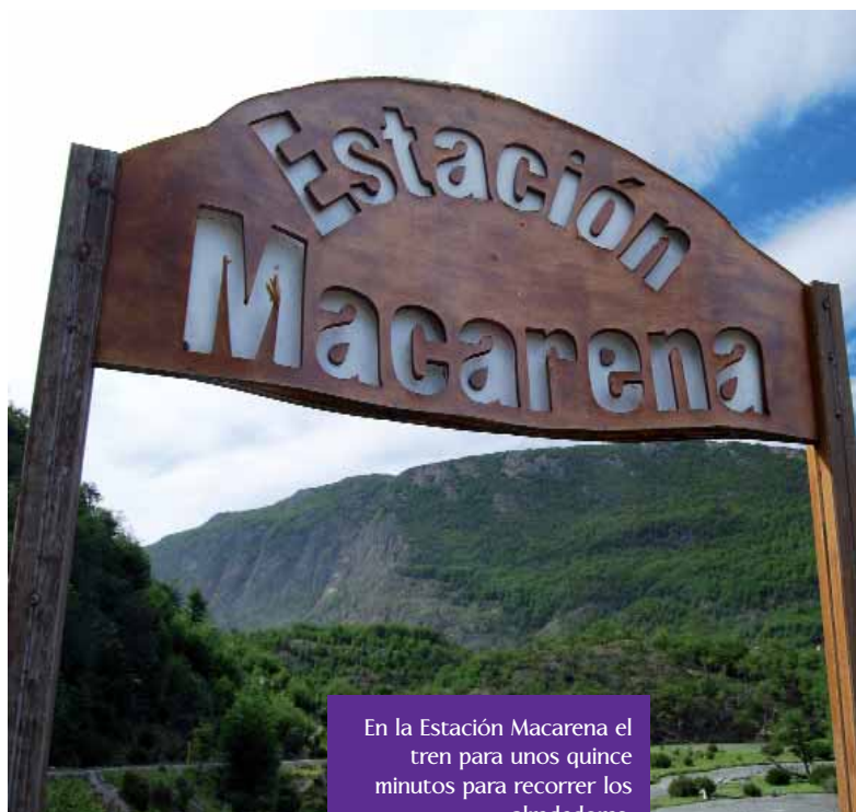
En la Estación Macarena el tren para unos quince minutos para recorrer los alrededores.

transporte salía todos los días del presidio hacia el campamento de tala de bosques, cruzando la ciudad por la costanera, por la actual Avenida Maipú.