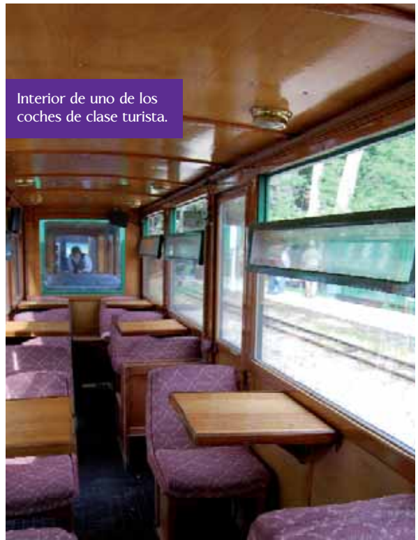
Interior de uno de los coches de clase turista.

El nombre de la isla proviene de la visión que tuvieron los miembros de una expedición española, al mando de Fernando de Magallanes, en agosto de 1520. Los navegantes divisaron desde el barco sorprendentes fogatas y por ello la nombraron "Tierra de los Fuegos", nombre que Carlos I de España luego modificó por "Tierra del Fuego". Dichas hogueras (encendidas incluso en las canoas) protegían del frío a los nativos que, a pesar del duro clima, apenas usaban ropa. Sólo el fuego y su especial adaptación corporal los mantenía calientes. Lamentablemente con la llegada de colonos blancos, los habitantes originarios fueron exterminados.