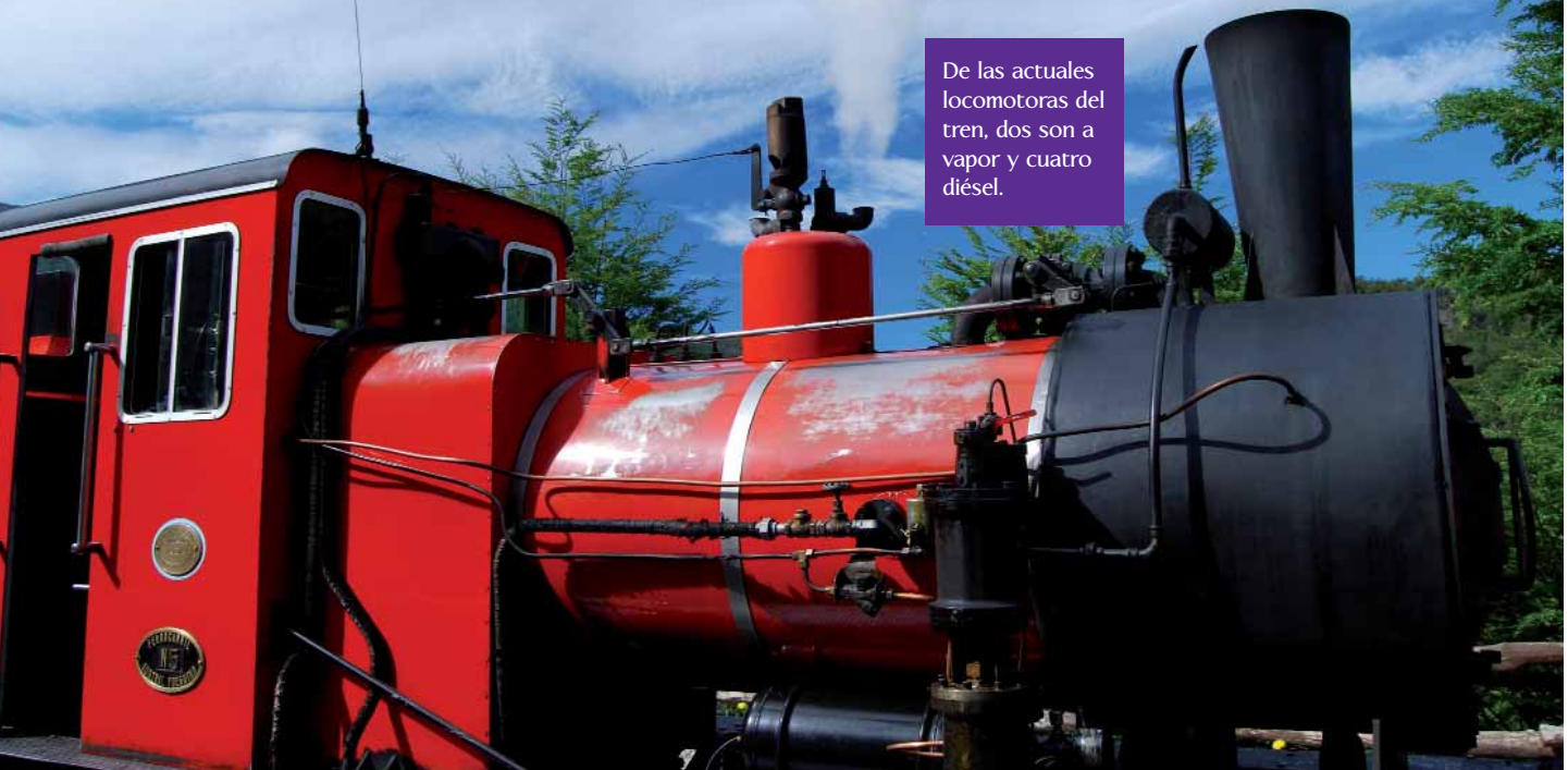
De las actuales locomotoras del tren, dos son a vapor y cuatro diésel.

se también para carga y descarga de mercadería del muelle al presidio y viceversa. El tren contó con locomotoras como la Orenstein & Koppel y la Jüing. En la actualidad se pueden ver la N°2 (una de las Orenstein & Koppel) y un coche en el predio del Museo de la Prisión. En un comienzo (y durante dos décadas) el tendido ferroviario corría por la ladera este del Monte Susana pero cuando las locomotoras originales no pudieron subir las partes más elevadas, el ramal continuó por el centro del valle del Río Pipo en lo que hoy es el Parque Nacional Tierra del Fuego.