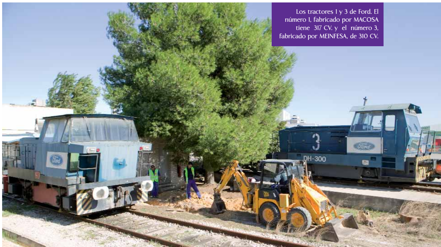
Los tractores 1 y 3 de Ford. El número 1, fabricado por MACOSA tiene 317 CV. y el número 3, fabricado por MEINFESA, de 310 CV.