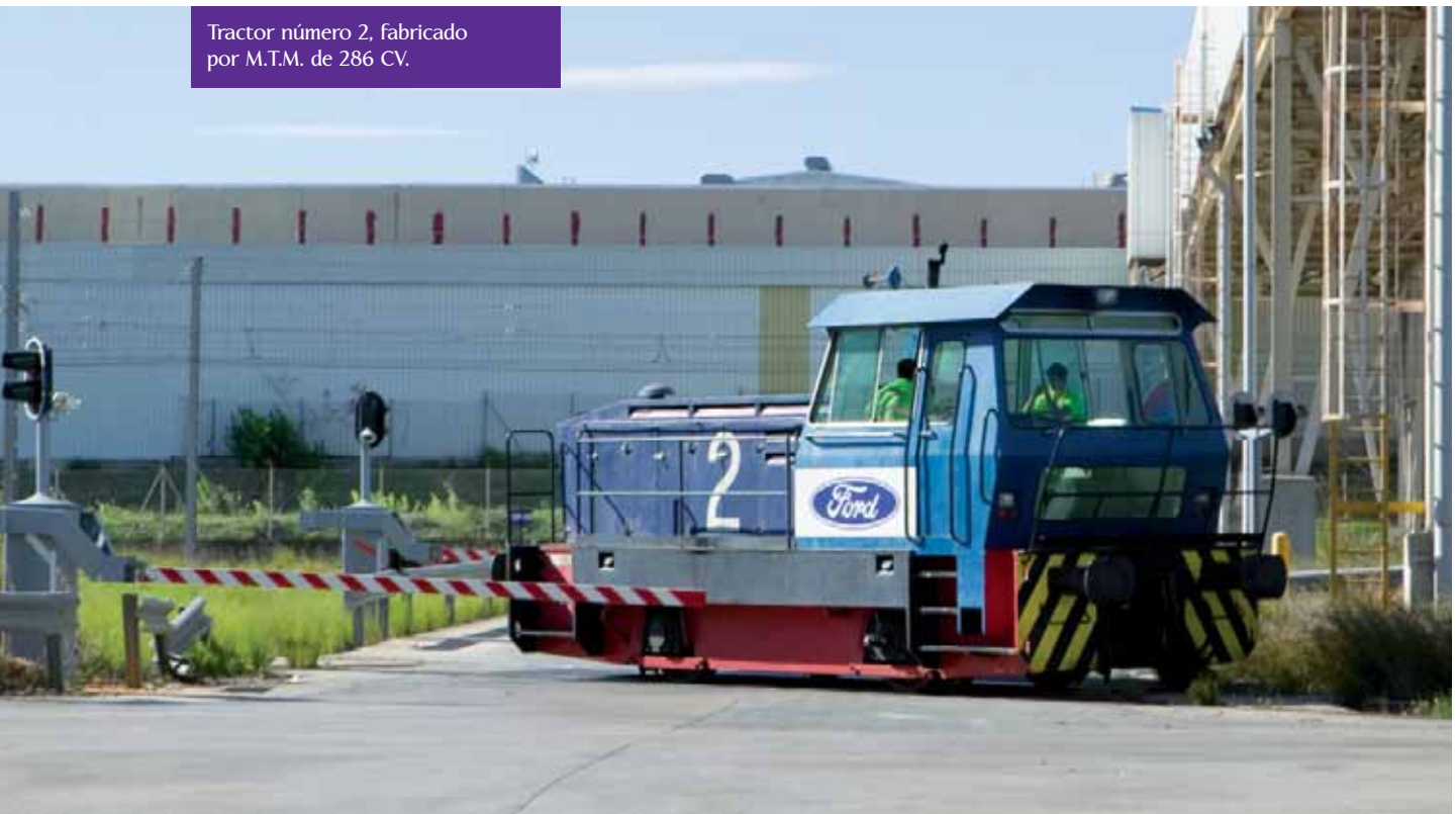
Tractor número 2, fabricado por M.T.M. de 286 CV.

Y si en sus comienzos ninguno de los cambios estaba enclavado ni señalizado, en la actualidad la mitad de los cambios de la playa de clasificación están enclavados, motorizados y con señales de protección. El total de la playa y vía de acceso cuenta con circuitos eléctricos de vía y comprobadores de ocupación. La gestión del