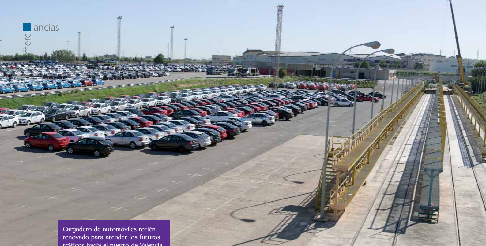
Cargadero de automóviles recién renovado para atender los futuros tráficos hacia el puerto de Valencia.

de cajas en la terminal, y otras dos de paso y acceso a los diversos muelles, entre ellos dos con rampas fijas de carga para automóviles.