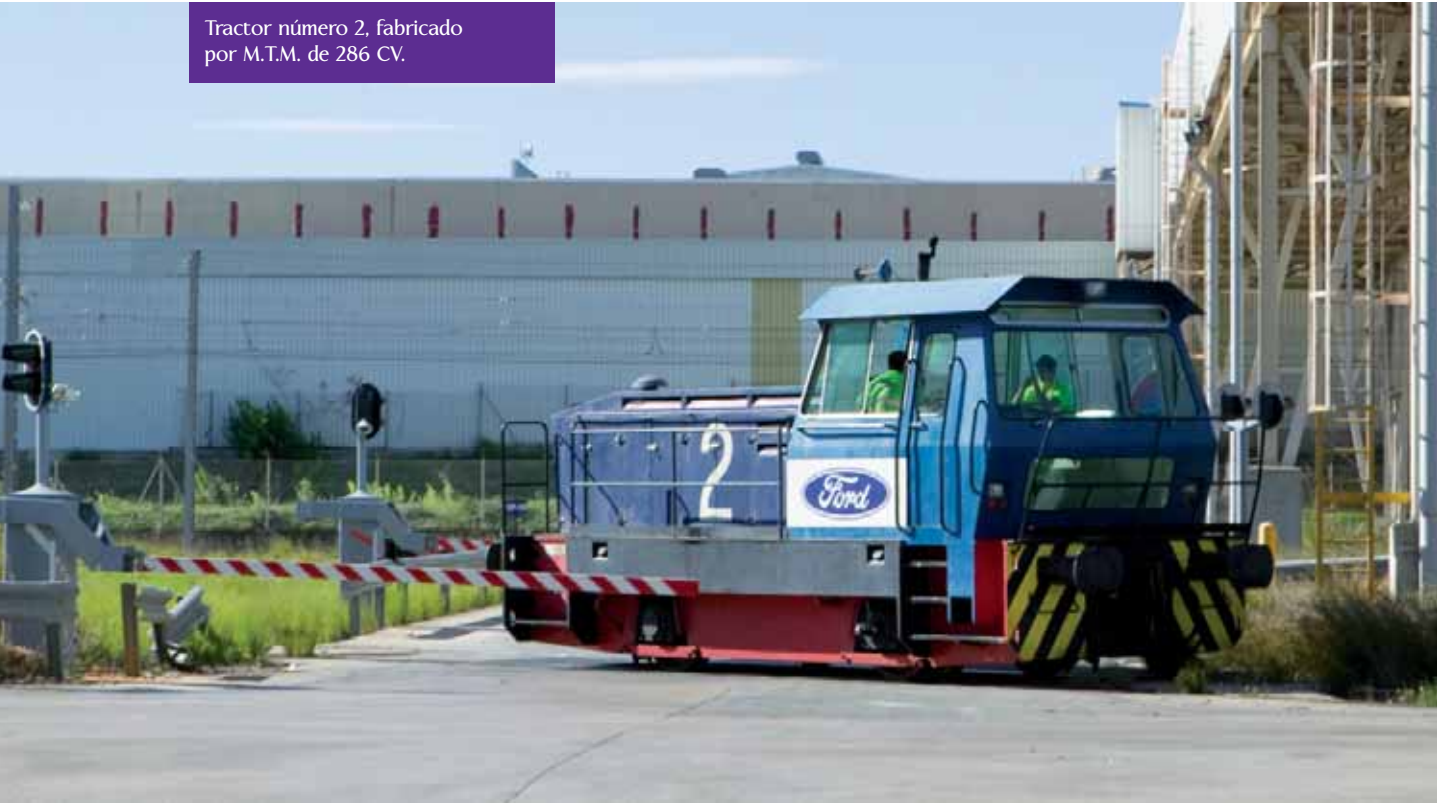
Tractor número 2, fabricado por M.T.M. de 286 CV.

Y si en sus comienzos ninguno de los cambios estaba enclavado ni señalizado, en la actualidad la mitad de los cambios de la playa de clasificación están enclavados, motorizados y con señales de protección. El total de la playa y vía de acceso cuenta con circuitos eléctricos de vía y comprobadores de ocupación. La gestión del