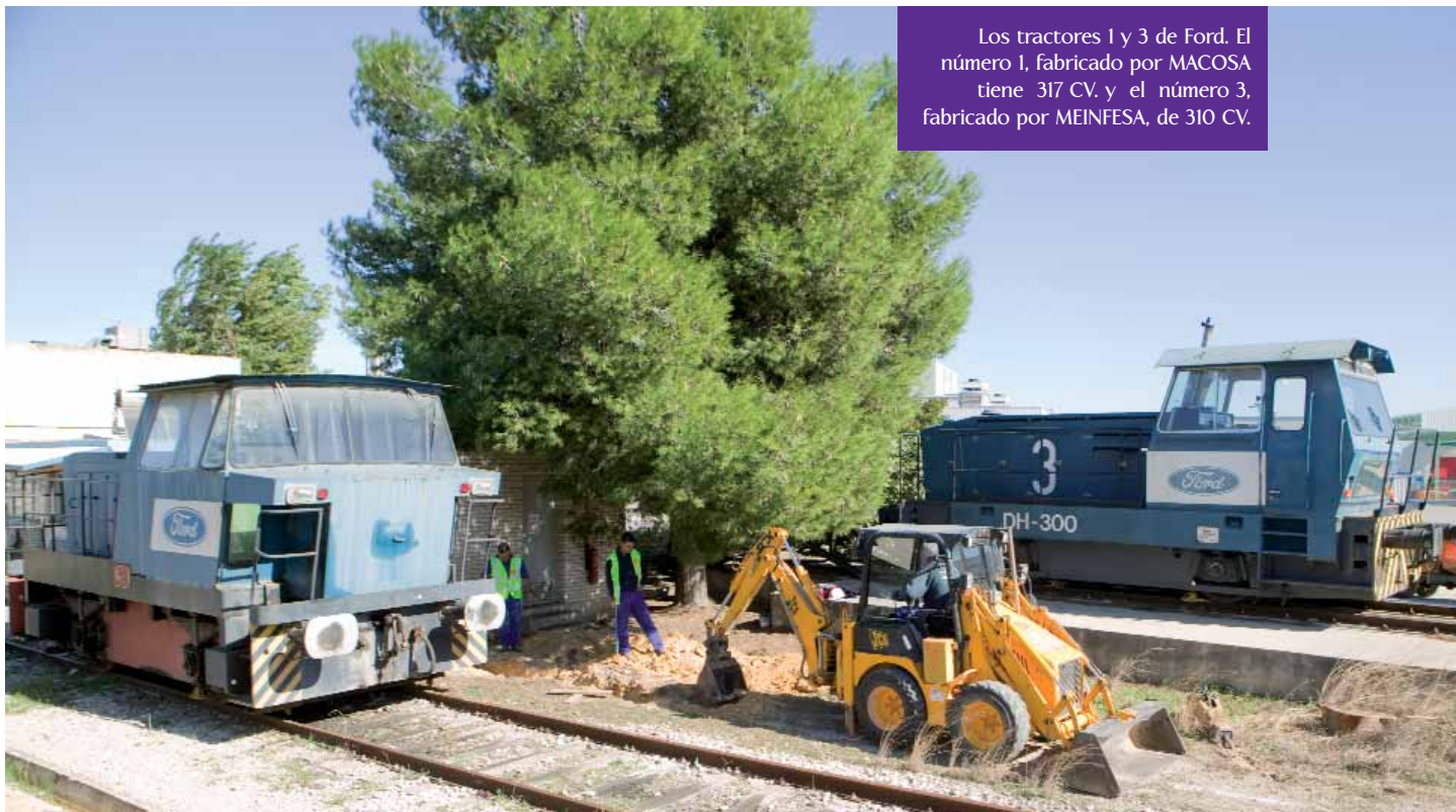
Los tractores 1 y 3 de Ford. El número 1, fabricado por MACOSA tiene 317 CV. y el número 3, fabricado por MEINFESA, de 310 CV.