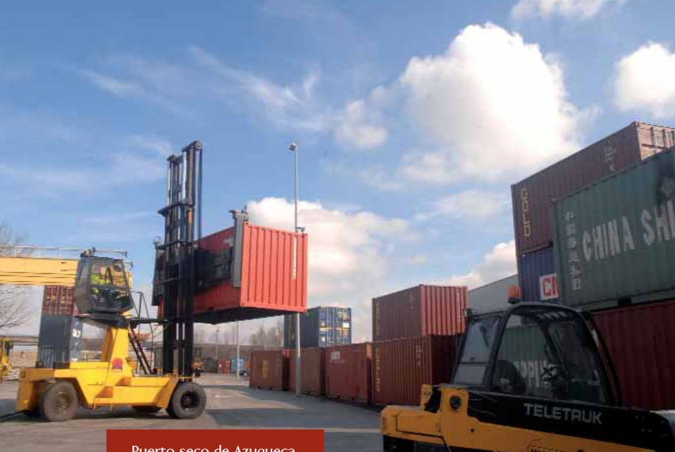
Puerto seco de Azuqueca.