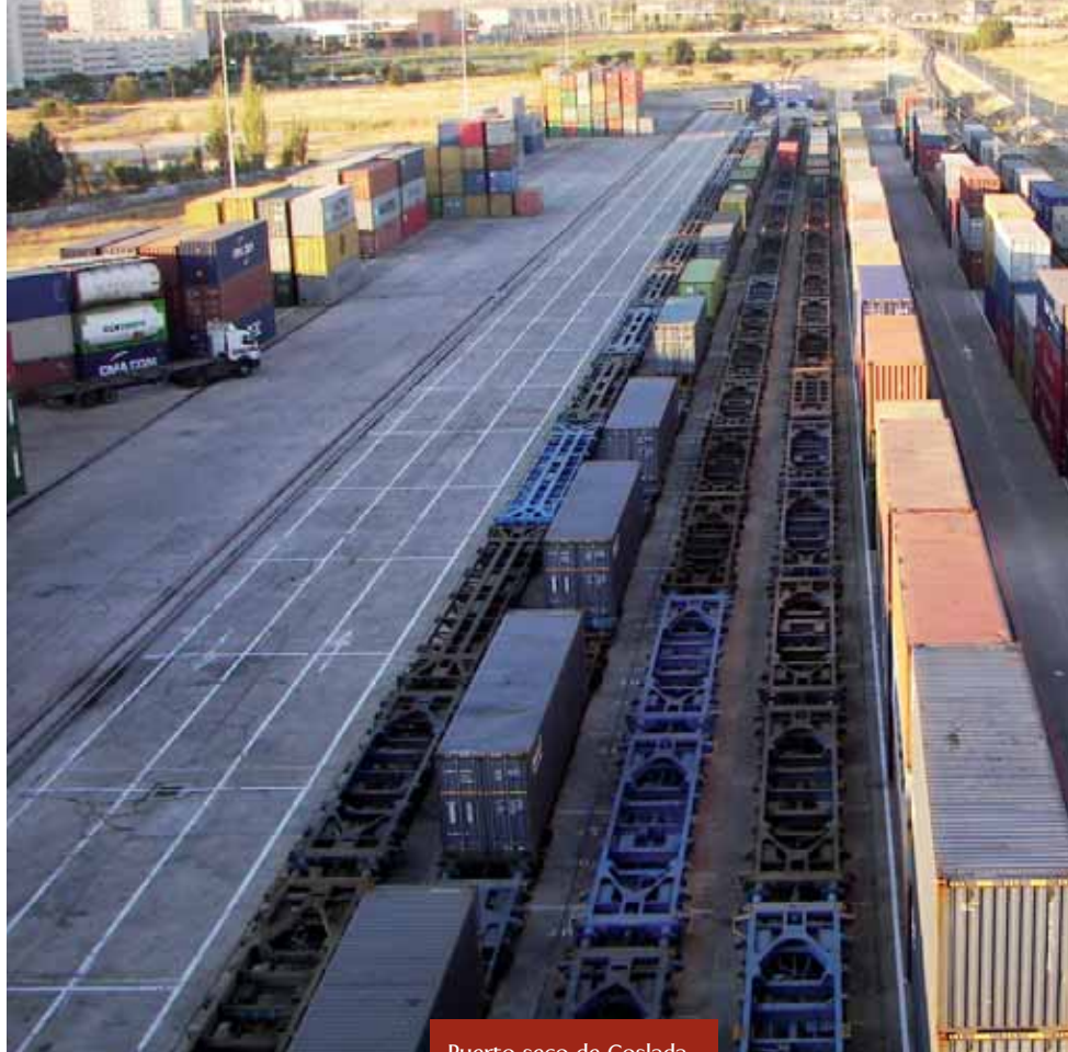
Puerto seco de Coslada.

Conterail, que gestiona por concesión la terminal, está participada por Renfe Operadora (46%),