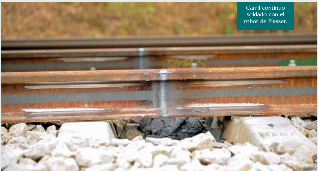
Carril continuo soldado con el robot de Plasser.

El software de mando del robot está preparado para trabajar con programas de soldadura para