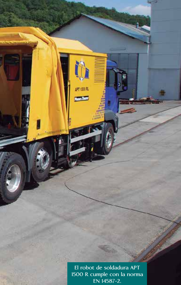
El robot de soldadura APT 1500 R cumple con la norma EN 14587-2.

locan en punta y las mordazas de apriete fijan los dos carriles. Cuatro sensores de distancia miden la nivelación vertical exacta. Tras seleccionar el tipo de carril se ejecuta con precisión la alineación horizontal.