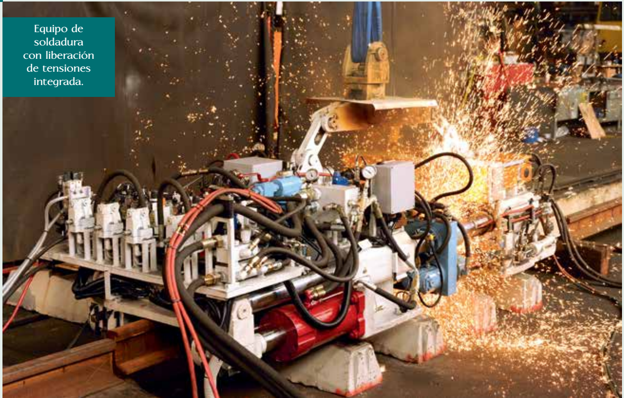
Equipo de soldadura con liberación de tensiones integrada.

El robot también cuenta con dispositivos para el enfriamiento controlado de la soldadura, según diagramas de temperatura-tiempo. Uno de ellos es la medición de temperatura integrada sin contacto. Los carriles de alta aleación se enfrían más despacio, con un postcalentamiento controlado mediante impulsos eléctricos, para que no se