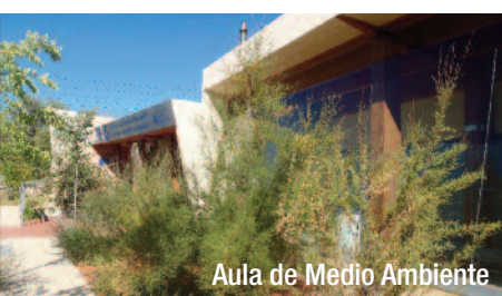
Aula de Medio Ambiente

Estación de Campus de Somosaguas (kilómetro 0). Desde los andenes salimos a la carretera que viene de Pozuelo y sigue a Húmera. Esta carretera pasa sobre las vías del Metro Ligero y dispone de un buen carril bici que va bordeando el perímetro del Campus de la Universidad en gradual descenso.