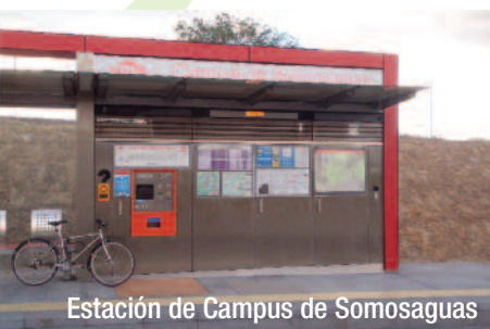
Estación de Campus de Somosaguas