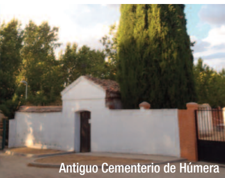
Antiguo Cementerio de Húmera