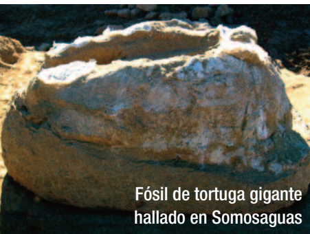
Fósil de tortuga gigante hallado en Somosaguas

Aula de Educación Ambiental de Pozuelo. Creada en 1994 dispone de un terreno de dos hectáreas y esta abierta a todo tipo de público como lugar de reflexión y de sensibilización con el planeta. Responsables del cuidado del Parque Forestal organizan multitud de actividades. Uno de los proyectos más curiosos es el “hospital de plantas”, un espacio donde se cuidan aquellas plantas que están en mal estado. Además el Centro de Recursos de Educación Ambiental para la Sostenibilidad (CREAS), gestiona gran cantidad de proyectos del Aula. Este edificio, fabricado con los principios de construcción sostenible, gestiona el agua, la energía y sus residuos de manera autosuficiente. Junto al recinto del Aula se encuentra el Parque Forestal Adolfo Suárez con 150 hectáreas de extensión, prolongación natural y complemento al vecino parque de la Casa de Campo. Para saber mas www.movilizared.es .