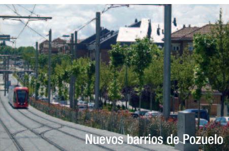
Nuevos barrios de Pozuelo