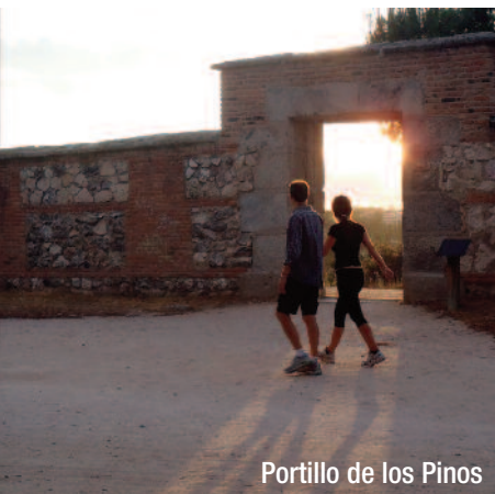
Portillo de los Pinos