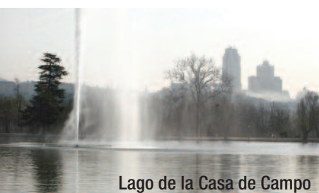
Lago de la Casa de Campo

Antiguo Cementerio de Húmera y Parque Forestal Adolfo Suárez (kilómetro 2,3). Para hacer mas ágil la visita proponemos seguir la carretera asfaltada que rodea en su totalidad el Parque. Este viario tiene tres kilómetros y recomendamos seguirlo en sentido contrario a las agujas del reloj. En primer lugar pasaremos por los dos estanques, el puente sobre el arroyo de Antequina y casi al final tras un repecho, el fantástico mirador sobre los edificios de Madrid.