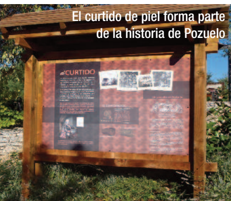
El curtido de piel forma parte de la historia de Pozuelo