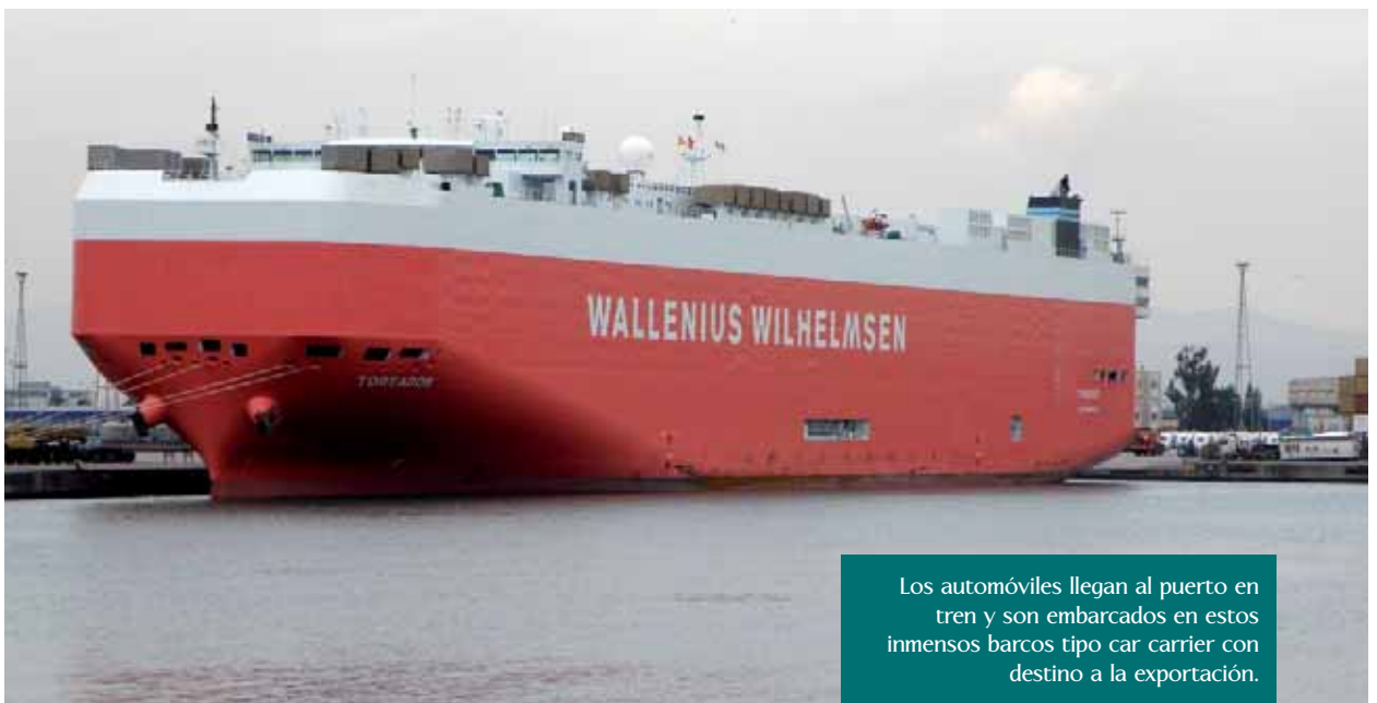
Los automóviles llegan al puerto en tren y son embarcados en estos inmensos barcos tipo car carrier con destino a la exportación.

desde Francia, sin necesidad ni de cambiar la carga en la frontera o de cambiar los ejes a los vagones, los dos sistemas que se utilizan en el tránsito fronterizo de las cargas en la frontera Portbou-Cerbère.