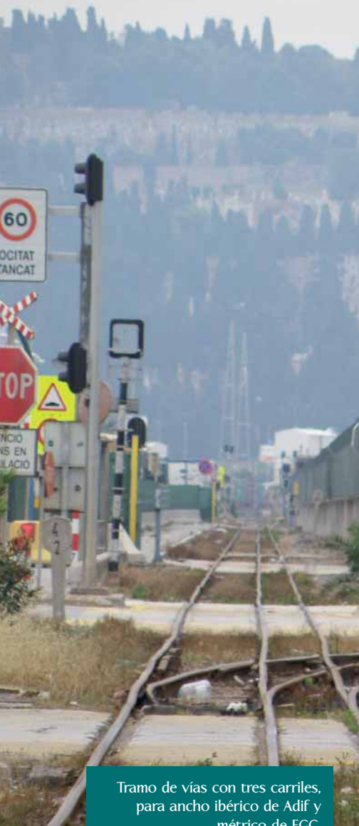
Tramo de vías con tres carriles, para ancho ibérico de Adif y métrico de FGC.

La inminencia de la llegada de este nuevo ancho al puerto ya se ha adelantado con la instalación del tercer hilo en los nuevos desarrollos de vía que se han ido realizando en el puerto desde el año 2003, pero es ahora cuando la autoridad portuaria acaba de licitar obras para adecuar diversos tramos de la red interior y de las terminales para poder recibir trenes en ancho estándar.