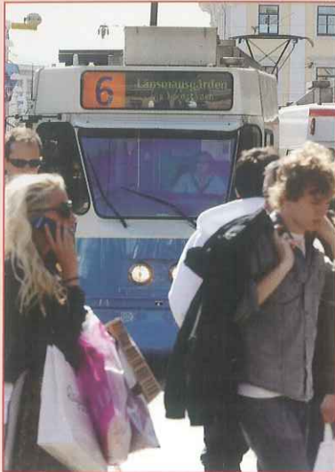
▼ Línea de tranvía 6, Gotemburgo, Suecia.