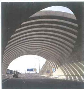
Abierta al tráfico la hiperronda de Málaga • Viaducto ferroviario de Archidona • Aprobados 26 nuevos proyectos del 1% Cultural • Ertms nivel 2, más velocidad para el AVE