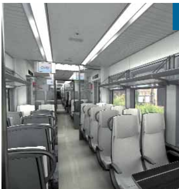
La zona de viajeros puede incorporar distintos equipamientos.

El tren también ofrece la posibilidad de instalar más o menos asientos o estrapontines longitudinales y apoyos isquiáticos, lo que permite adaptarlo a la demanda real de transporte del servicio.