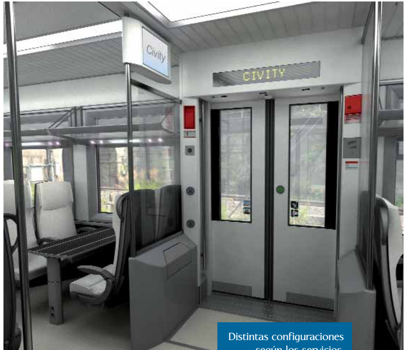
Distintas configuraciones según los servicios.

Además de esa flexibilidad en las configuraciones, la modularidad aplicada en el diseño de Civity permite también la adaptación a distintos y tipos de servicios y de usuarios. Así el número de puertas por coche, una o dos por costado, permite atender distintas necesidades de flujos de entrada u salida de viajeros en función del tipo de servicio a realizar.