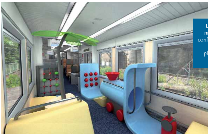
Distintos módulos y configuraciones de la plataforma Civity.