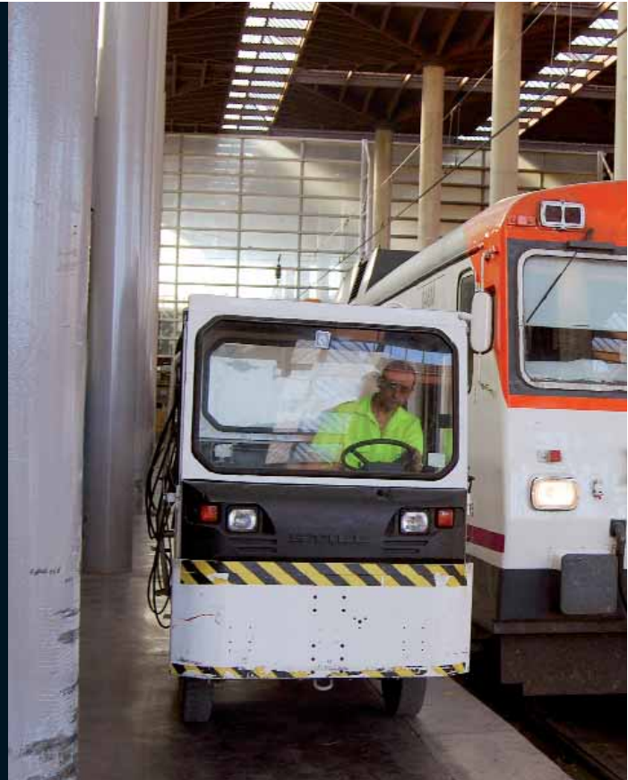
Las vías 12 y 13 fueron las últimas que acogieron trenes de ancho ibérico.