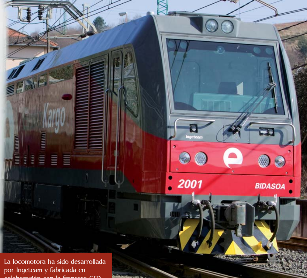
La locomotora ha sido desarrollada por Ingeteam y fabricada en colaboración con la francesa CFD.

tenedores, palanquilla, perfiles, tubos, madera en rollo y elaborada, etc- que, construidos por Tafesa, se utilizan en la actualidad en los tráficos conjuntos que Euskokargo y Feve realizan entre Avilés y Lasarte.