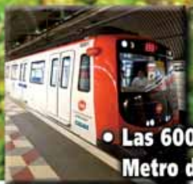
• Las 6000 de Metro de Barcelona