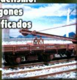
• Modelismo: Vagones unificados