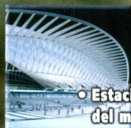
• Estaciones del mundo: Lieja