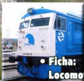
• Ficha: Locomotoras 313 y 321