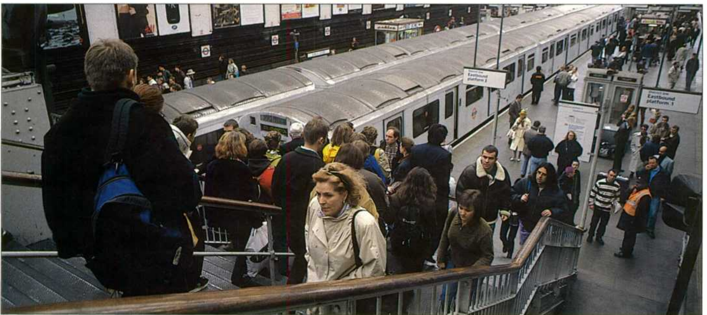
Metro de Londres.

63 millones de personas, es decir, el 14 por ciento de la Europa de los 25, con dos metrópolis, Londres y París-Ile de France, a la cabeza de las áreas más densamente pobladas del mundo, con más habitantes que algunos países de la UE. En segundo término, figuran metrópolis como Barcelona, Berlín, Francfort Rin/Maine y Madrid, con una población aproximada de cinco millones de habitantes.