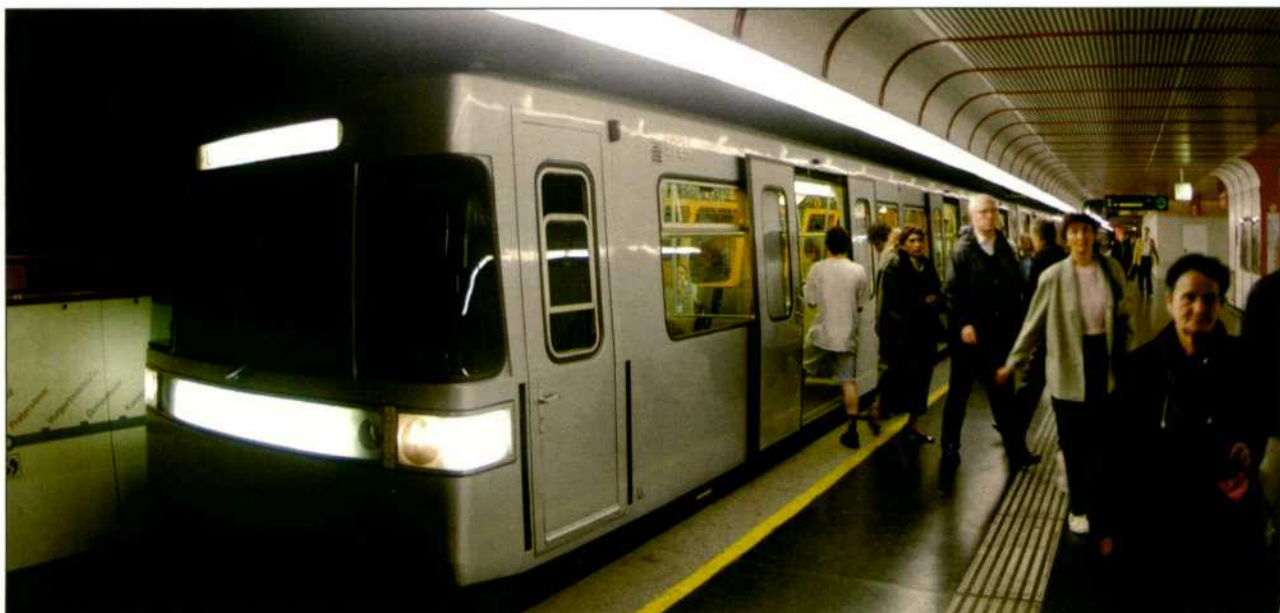
Metro de Viena.

V IA LIBRE publicaba en su número 481 (páginas 29-30) un reportaje titulado "El transporte público supone el 50 por ciento de los viajes realizados en las grandes ciudades europeas", acompañado de dos gráficos con cifras relativas a la movilidad de las grandes metrópolis europeas. Por un error de imprenta, la primera línea de cada gráfico se desplazó de lugar, lo que puede dar origen a interpretaciones incorrectas. Dado su interés, y, a petición de los lectores, volvemos a publicar estos dos gráficos, añadiendo, además, otros nuevos que no pudieron incluirse en su momento.