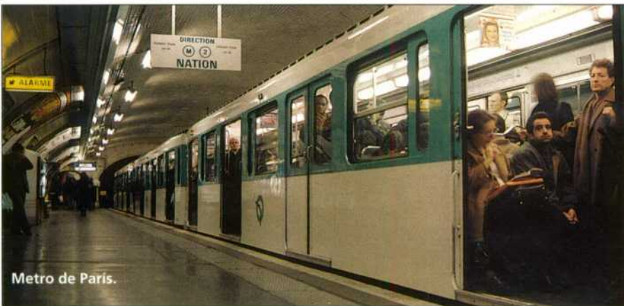
Metro de París.

63 millones de personas, es decir, el 14 por ciento de la Europa de los 25, con dos metrópolis, Londres y París-Ile de France, a la cabeza de las áreas más densamente pobladas del mundo, con más habitantes que algunos países de la UE. En segundo término, figuran metrópolis como Barcelona, Berlín, Francfort Rin/Maine y Madrid, con una población aproximada de cinco millones de habitantes.