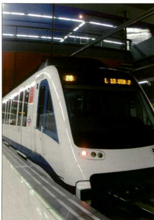
Metro de Madrid.

Como conclusión más destacada hay que señalar que el transporte público representa más del 50 por ciento de todos los viajes motorizados realizados en las áreas metropolitanas más densamente pobladas de Europa, y que el número de líneas de tranvía está aumentando muy rápidamente en varias metrópolis europeas, lo que confirma el éxito