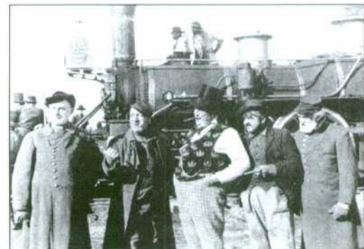
"Unión Pacífico" de Cecil B. De Mille (1939).

Ferrocarril y cine negro. El ferrocarril además de ser un valor claramente rentable para el western, también lo ha sido para otros géneros cinematográficos como propiamente el cine negro y la intriga criminal. Sus espacios sirven para el encuentro de personajes de orígenes y dedicaciones más que sospechosas. Evidentemente, uno de los maestros que mejor ha sabido llevar esta demostración criminal ha sido Alfred Hitchcock en "Alarma en el expreso" (The Lady Vanishes, 1938). La acción se ubica en el interior de un tren expreso, donde la intriga, el suspense y la sensación de claustrofobia se potencian considerablemente. Este recurso sería empleado en varias películas, incidiendo en el uso psicológico de todos los espacios cerrados, caso del film de Hitchcock "Extraños en un tren" (Strangers on a Train, 1951). El vagón de un tren es el lugar de encuentro de dos personajes con intenciones similares, el asesinato doble, para ello cada asesino en un intercambio de amistad diabólica decide matar a la persona señalada por su socio-asesino. Hitchcock