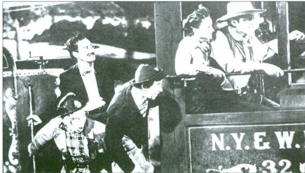
Los Hermanos Marx en el Oeste (1940).

Dentro del cine mudo, debemos destacar "El caballo de Hierro" (The Iron Horse) de John Ford, en 1924, donde se muestra la auténtica competencia entre la Union Pacific y la Central Pacific por el control del tendido de la vía ferroviaria transcontinental. Se aborda el espíritu de una nación que debe construir el ferrocarril transamericano, toda una epopeya que requirió la colaboración de cifras impresionantes para la fecha. Esta obra considerada por el director como una de sus