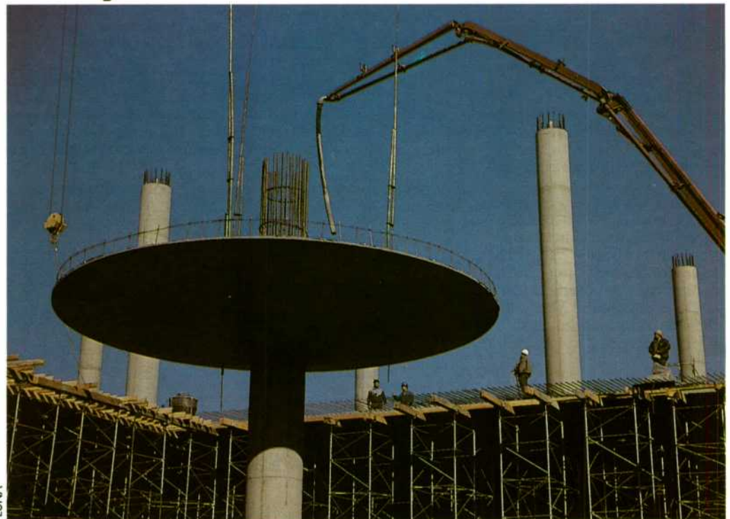
LUNA Una inversión de 6.700 millones para la rehabilitación y nueva construcción.

Cuando en abril de 1992 se inaugure la nueva estación de Atocha para alta velocidad, esta estación será un completo centro que acogerá -además de las instalaciones ferroviarias- centros comerciales, galerías de arte y establecimientos de servicio público de todo tipo. El objetivo del grupo AVE es bien claro: ofrecer el servicio más completo posible al usuario de la alta velocidad. Al final, entre las obras de rehabilitación de la vieja estación y las labores de nueva construcción, en total se habrán invertido más de 6.700 millones de pesetas. Julio César Rivas