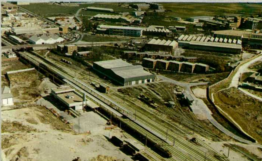
Nueva Estación de Vicálvaro 3ª y 4ª vía Vallecas-Vicálvaro y vías de ancho métrico del FF.CC. de Tajuña.