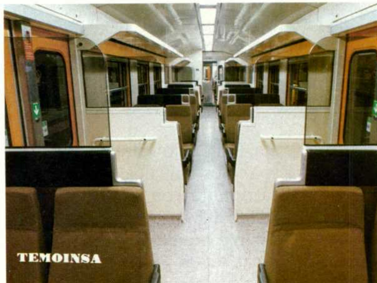
Transformación de Coches de la Serie-5.000 a Serie 6.000 efectuado en los Talleres de Rocafort de Llérida para los Ferrocarriles de la Generalitat de Catalunya.

Proyecto de transformación de Coches-literas de la Serie-8.000 a Serie-12.000 efectuado en los Talleres Centrales de Reparación de RENFE en Málaga.