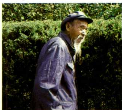
Chinos, mongoles y algún turista europeo, suelen ser los viajeros habituales del tren.