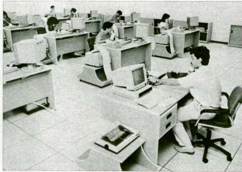
Un aspecto de las nuevas oficinas de reserva telefónica de billetes.

COCHES-GUARDERÍA EN LOS TRENES. —El servicio de coche-guardería, iniciado el día 15 de julio en la relación Madrid Chamartín-Alicante (en rápido diurno y con uno o dos servicios diarios) supone una importante mejora del confort, tanto para los viajeros con niños como