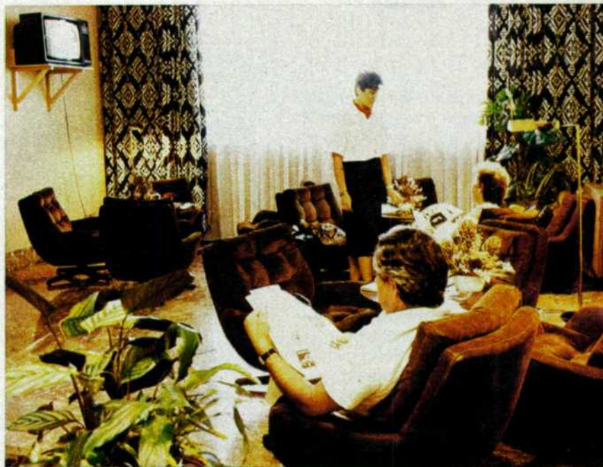
Las salas especiales de espera, una fórmula de ocupación del tiempo entre tren y tren.

Con este primer paso se comenzaba el plan de apertura de consignas en toda España, que