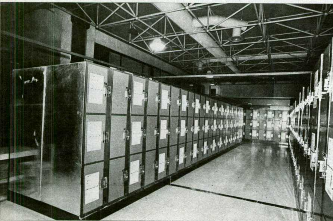
Estación de Barcelona-Sants: las consignas automáticas con sistema detector de explosivos están ya a disposición del público. Como en Madrid y otras capitales.

El Plan de Modernización y Equipamiento de Estaciones, que con carácter extraordinario