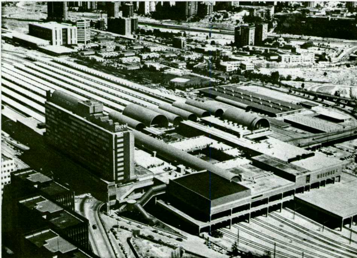
El hotel Chamartín ha sido uno de los primeros establecimientos en ofrecer al transeúnte las ventajas del hotel de día.

SALAS RAIL-CLUB. —Sobre las ya existentes en Madrid-Chamartín, Madrid-Atocha y Barcelona-Sants, RENFE pro-