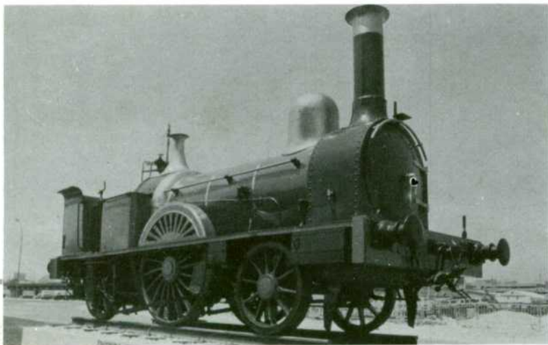
La 1-1-1, por las fechas en que fue instalada (1975). Obsérvese al fondo que las "Caracolas" no estaban aún levantadas.

para el Ferrocarril de Madrid a Cáceres y Portugal, matriculada como MCP 161. En 1928 pasó a denominarse Oeste 161, y ya en RENFE obtuvo la numeración 030-0224. Desde los años veinte ha realizado maniobras en Madrid-Delicias hasta ser sustituida por tractores Diesel, y sólo ha abandonado esa estación, debidamente pintada y adecentada, para presidir el monumento junto a Chamartín.