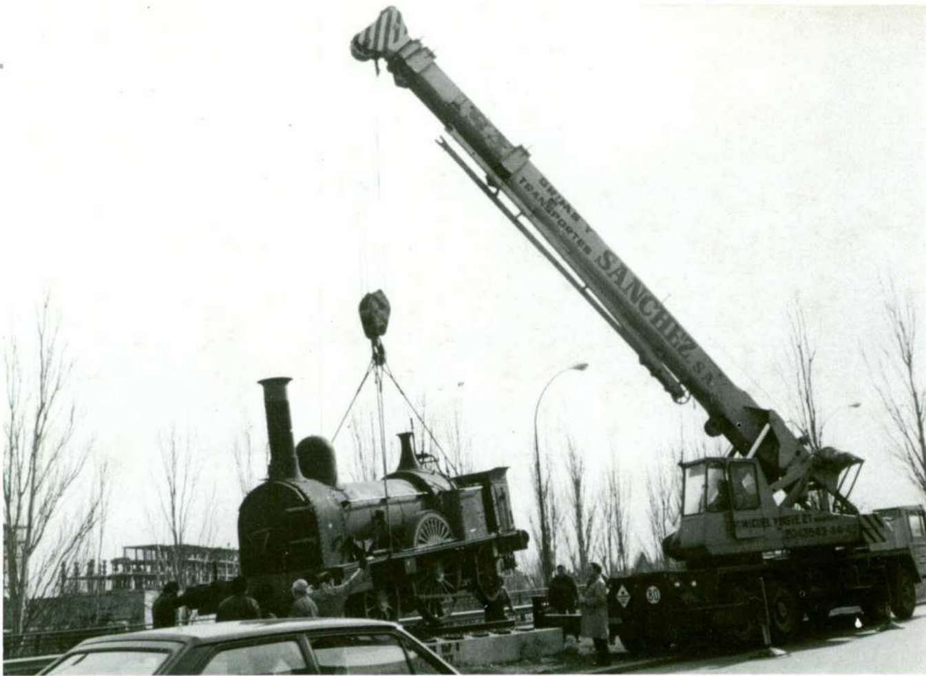
Una potente grúa izó, el día 7 de febrero, la primitiva máquina del monumento para trasladarla en camión al M. N. F.