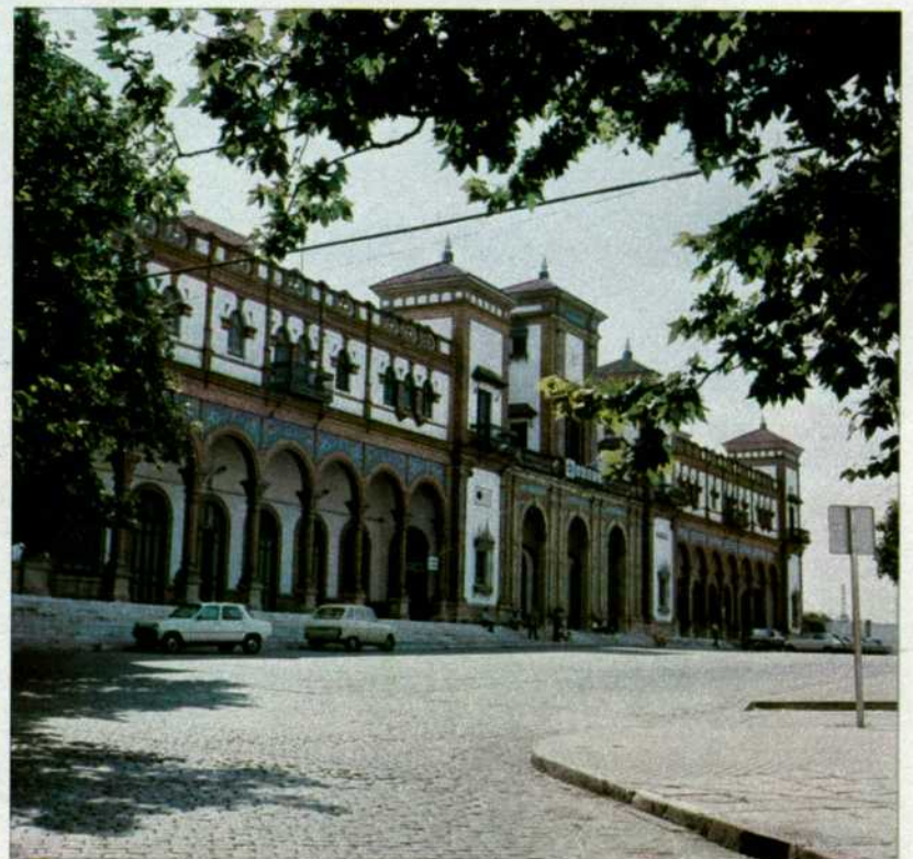
Estación de Jerez de la Frontera, nuevos aseos para el público.