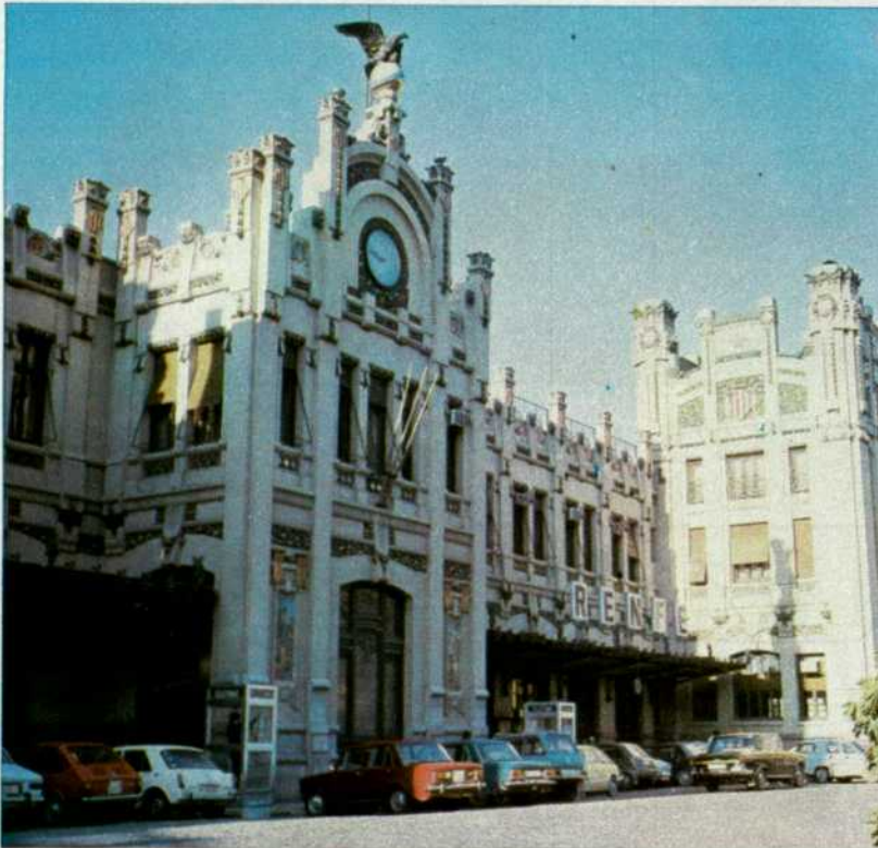
Valencia-Término tendrá mejores andenes y marquesinas.