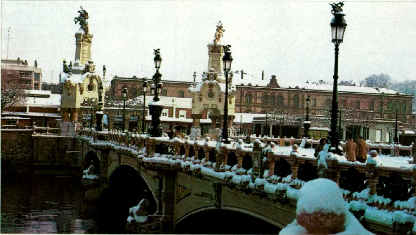
San Sebastián: El puente de María Cristina, acceso a la estación, ha sido restaurado primorosamente por el Ayuntamiento donostiarra.