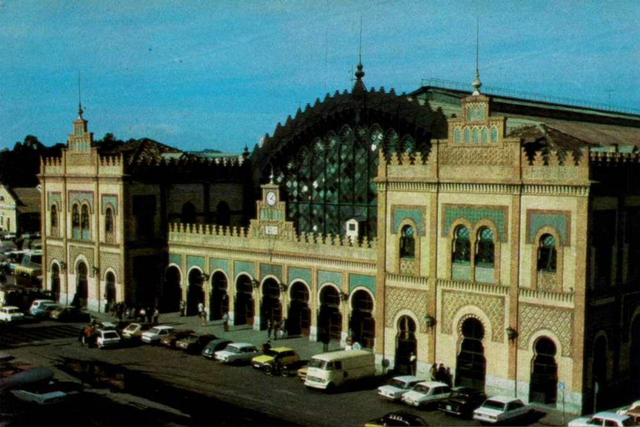
Sevilla-Plaza de Armas: Se va a reparar la cubierta del edificio de viajeros.

— Los Romanos (construcción de nuevo apeadero).