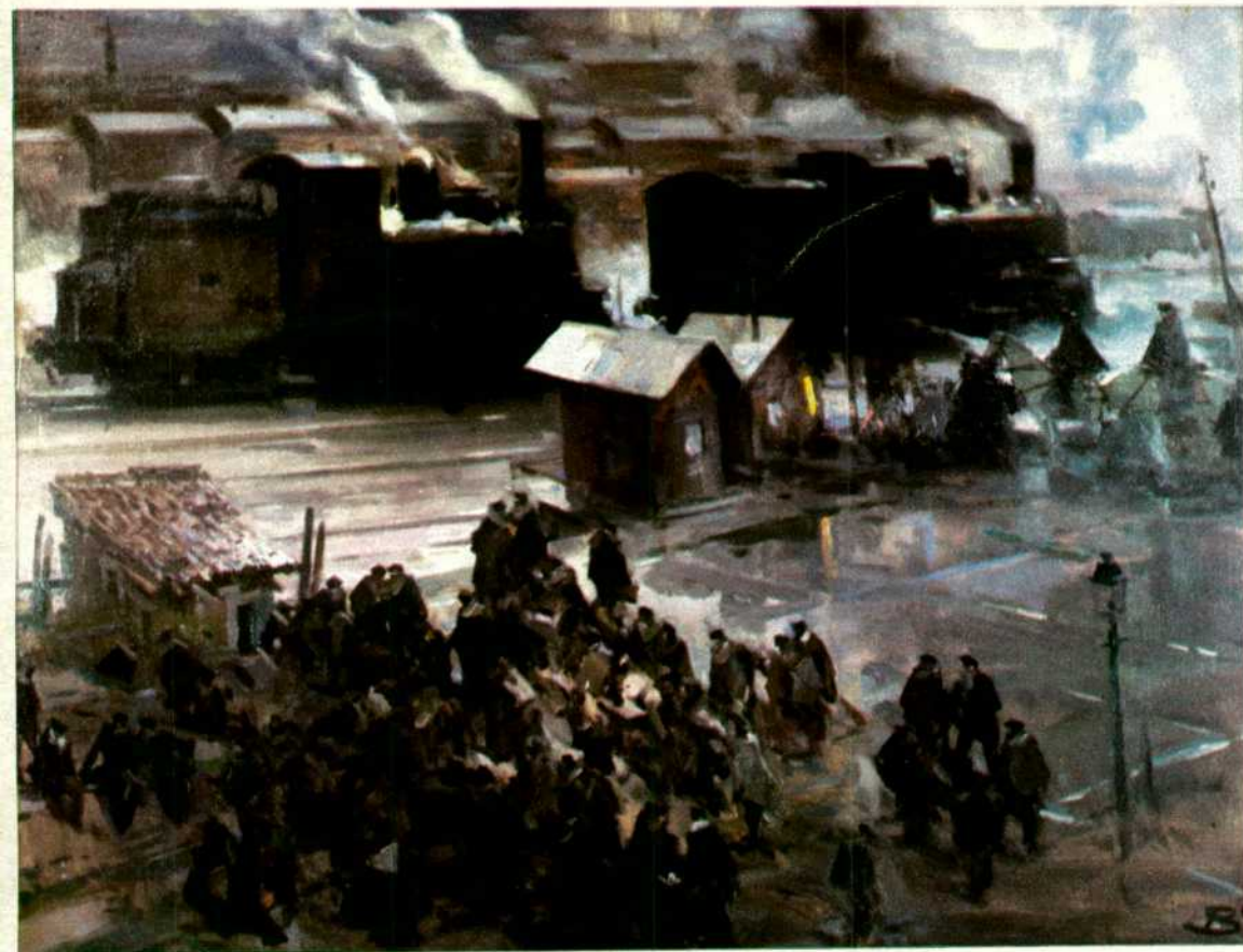
"La huelga", óleo sobre lienzo. 81 por 100 (1973). De colección particular.