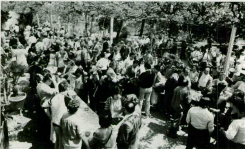
Los participantes a las Jornadas, en una de las muchas recepciones que les fueron ofrecidas.