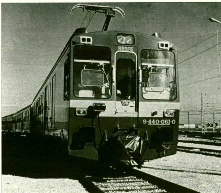
En los dos últimos años, RENFE ha contratado la adquisición de nuevo material por valor de 60.000 millones de pesetas.

El señor Bayón dio a conocer a los informadores, de forma esquemática, el contenido del Plan de Actuación en los servicios de viajeros, cuyos puntos más destacables resumió así: