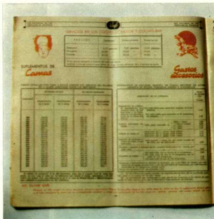
Interior de un ejemplar de "Grandes líneas".