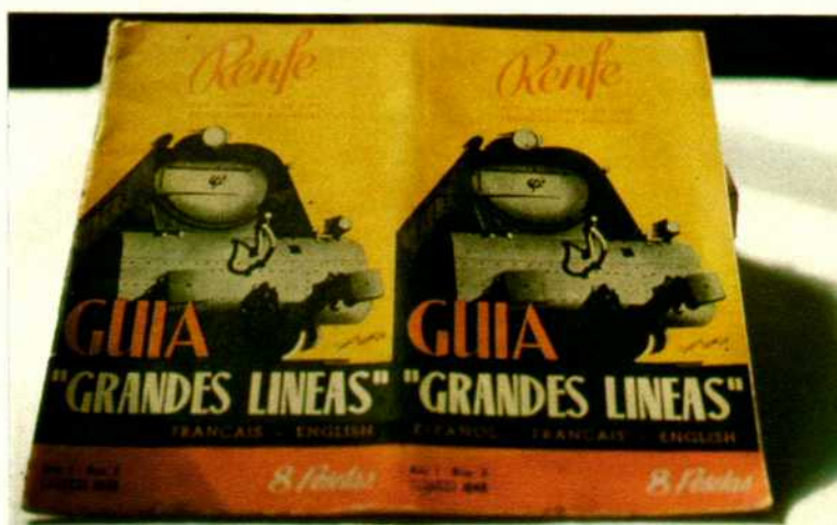
"Grandes líneas" fue la primera guía editada por RENFE.