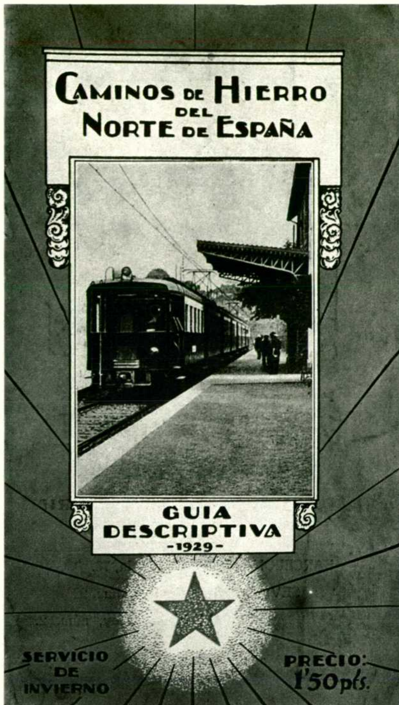
Las guías descriptivas, como ésta, informaban al viajero al tiempo que le proporcionaban tema de lectura y divertimento.

En este apartado encuentra también su lugar el Itinerario guía del colegio de Huérfanos Ferroviarios . La primera fecha de referencia es del año 1958 y la última de 1963. Tenía, aproximadamente, 290 páginas, periodicidad mensual y los beneficios que reportaba eran destinados al colegio de Huérfanos.