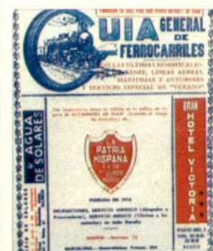
Más de novecientos números publicados y ochenta años de existencia es el importante bagaje de la "Guía general de ferrocarriles". En el grabado, una portada reciente.