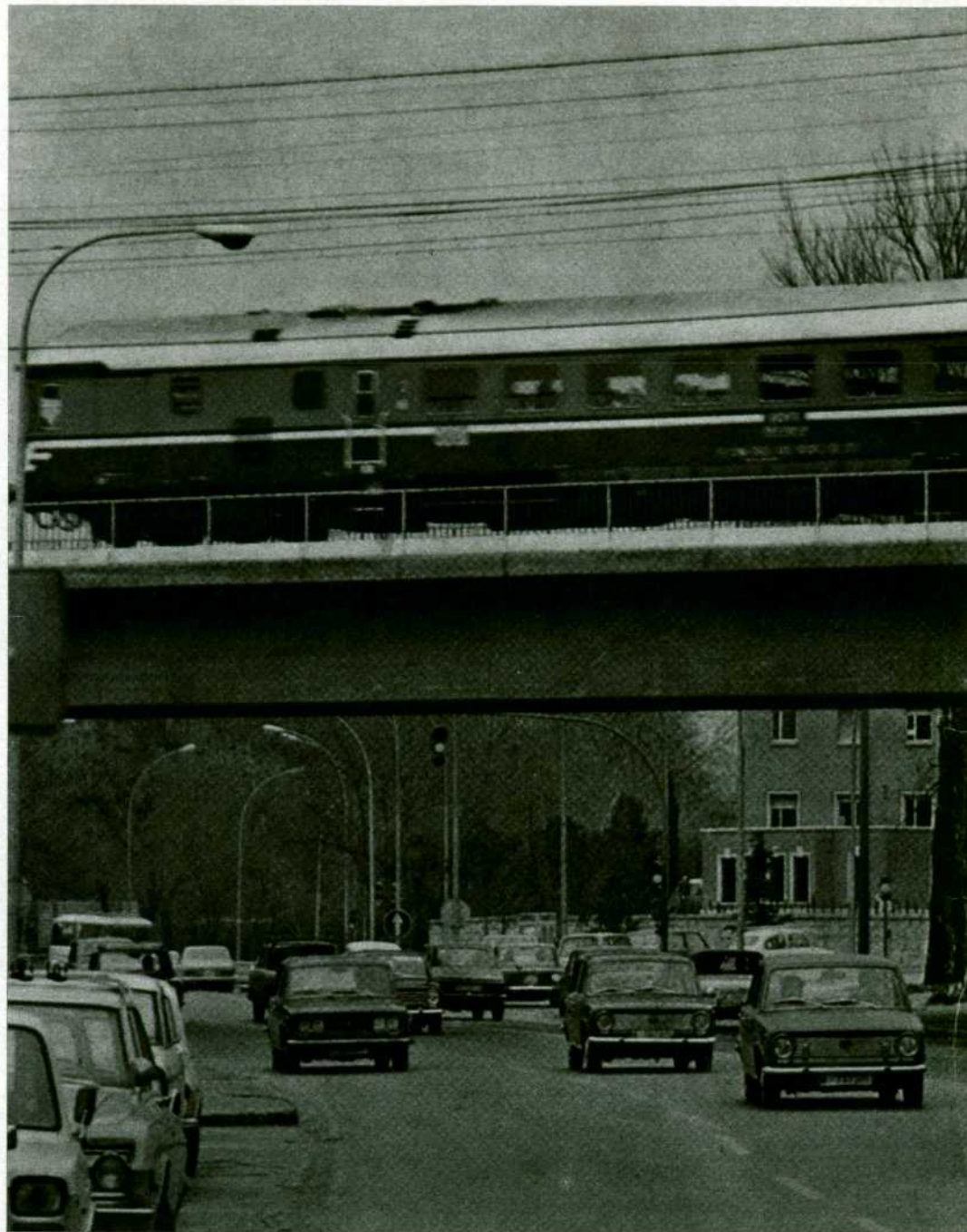
Los pasos a distinto nivel atenúan el grave problema creado por el impresionante aumento del parque de automóviles y camiones.

La inversión global realizada en la red de acuerdo con el Plan de