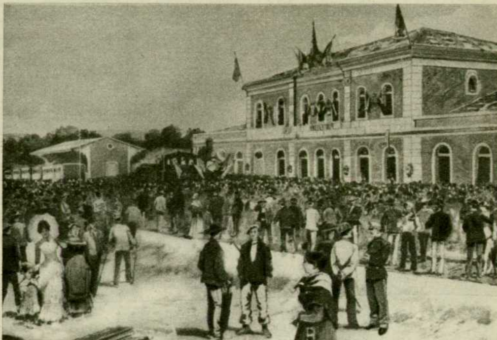
Bendición de la locomotora «Pontevedra» con motivo de la inauguración del ferrocarril Redondela-Pontevedra.