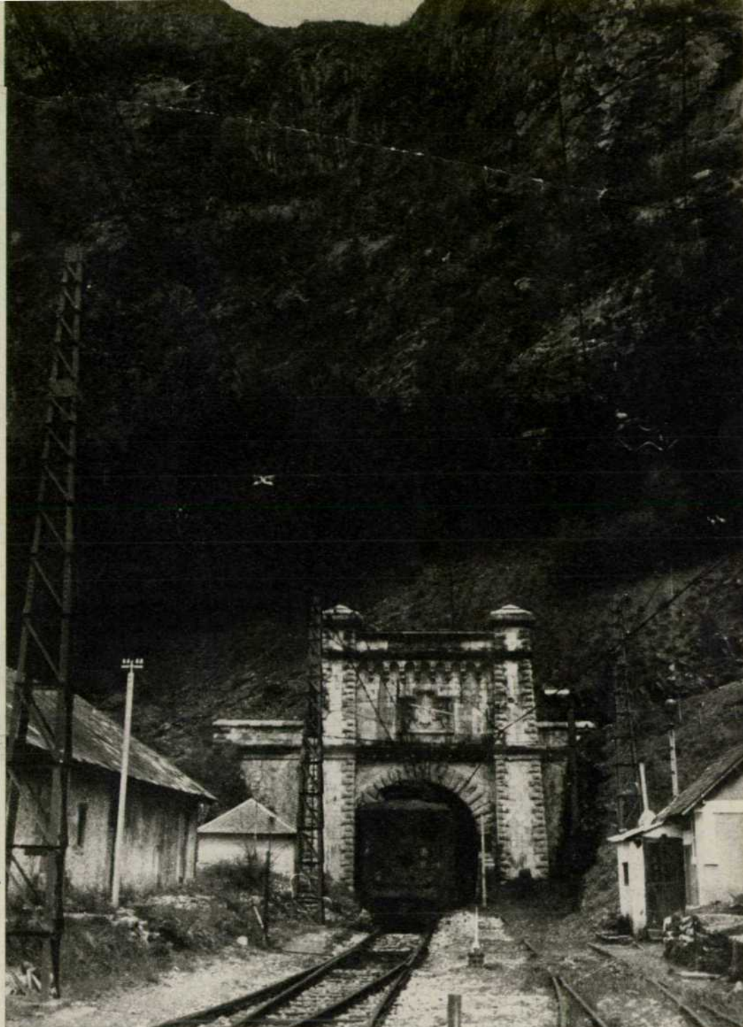
Un túnel importante: Somport.